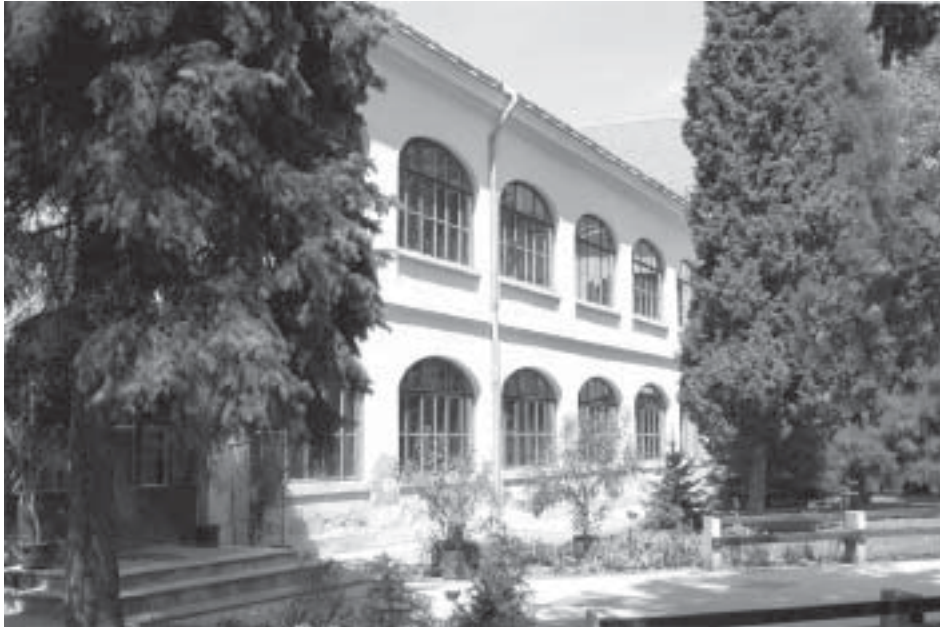
A sokat megélt Batthyány-gimnázium