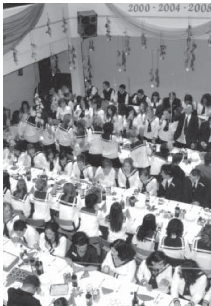
Együtt is ünnepeltünk