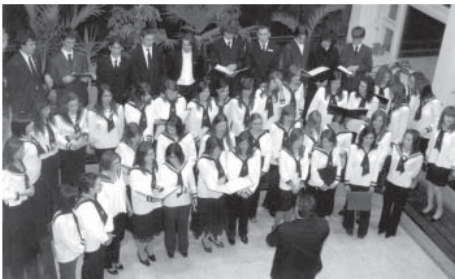
A Virág Benedek Kórus a kisaulában