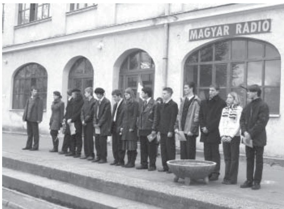
Szép és méltó volt az október 23-i iskolai ünnepélyünk