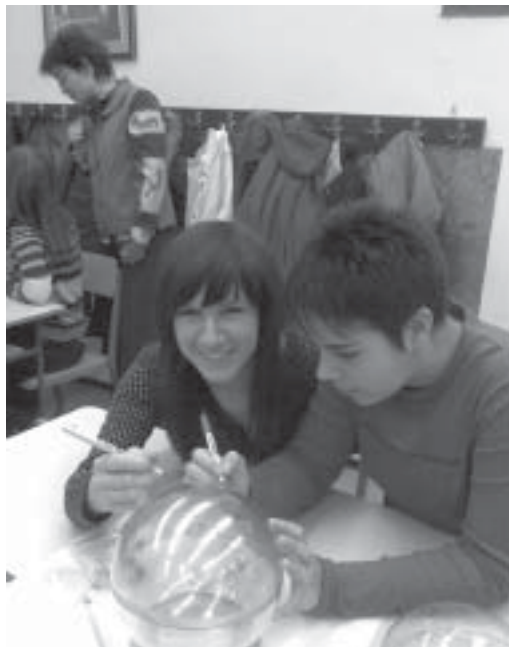
Az én Lénárt-gömböm..