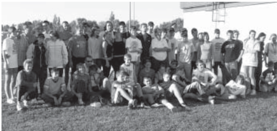
Batthyánys futók — pihenõben