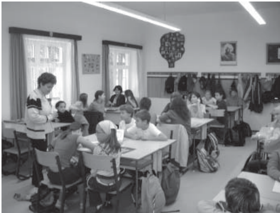
De még jobb a csoportmódszer