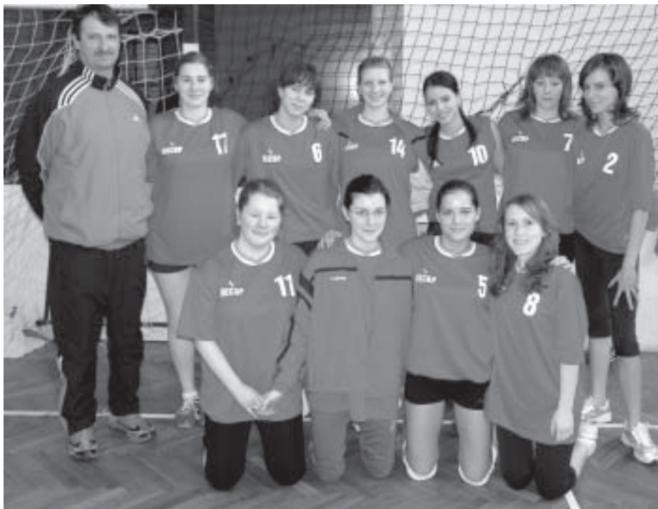
A BLG amatőr röplabda leány csapata

Továbbra is népszerű a „Batthyánysok Ligája” nevű iskola focibajnokságunk