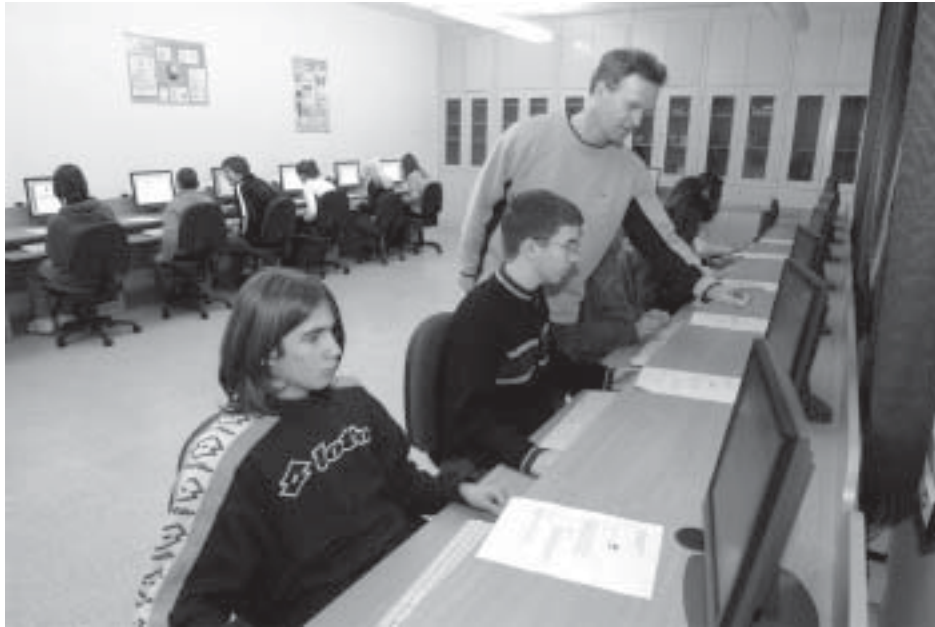
Jó az IKT és az SDT is....