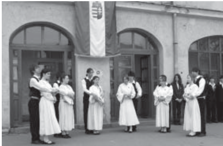
A március 15-i ünnepélyünk is emlékezetes volt